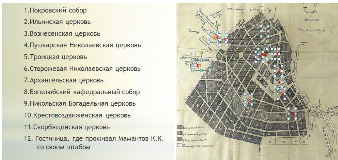
Рисунок 3 - План города Козлова [10] с указанием мест расположения церквей и гостиницы, где находился штаб 4-го Донского казачьего корпуса Добровольческой армии.

Утром 24 августа 1919 года к Мамантову К.К. в гостиницу (она располагалась в центре Козлова), именно здесь находился генерал со штабом корпуса, пришла депутация облаченных в священные одежды священнослужителей Козловских церквей. Для оценки числа депутатов необходимо учесть компактность расположения церквей, состав церковных причтов [4-5], места проживания неправославных граждан (в том числе и иудеев), число возможных свидетелей погромов хозяйств, а также время необходимое для организации депутации.