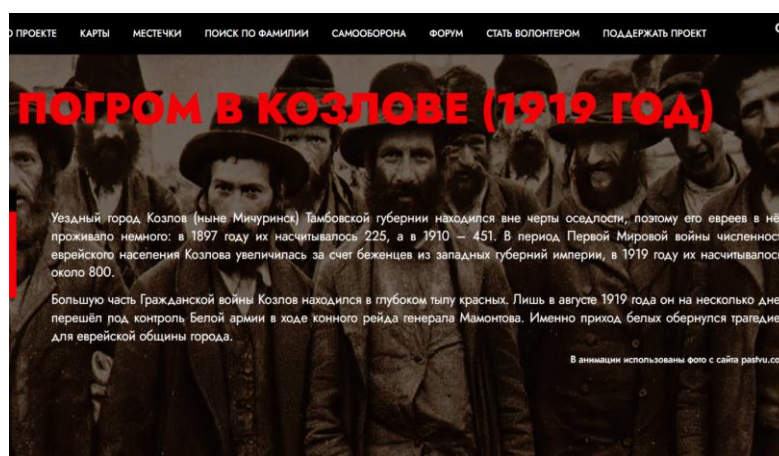
Рисунок 1 - Скриншот первой страницы сайта, опубликованного на русском языке гражданами Израиля.

Немного хронологии, опираясь на данные различных источников и воспоминания очевидцев [1], можно констатировать следующее. Авангард 4-го Донского казачьего корпуса Добровольческой армии под командованием генерал-лейтенанта Мамантова К.К. ворвался в Козлов после трех часов дня 23 августа 1919 года. 24 августа в Козлове было создано Временное городское самоуправление. 25 августа Козлов был оставлен штабом корпуса. Силы корпуса оставляли Козлов и села Козловского уезда вплоть до 30 августа 1919 года, уходя в северо-западном направлении. Так частью сил корпуса был занят Раненбург – это самая северная точка на пути корпуса [2].