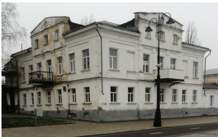
Рисунок 6 - Козлов. Дом Мачехина (наши дни). Здесь в конце августа 1919 года располагалось Временное городское самоуправление.

коммунистами большевиками. Мирное население должно спокойно заниматься своим делом. Мною учреждены Временное городское самоуправление и милиция, к которым население должно обращаться по всем вопросам. К прекращению грабежей и насилия меры приняты. Все причиненные войсками убытки население будет удовлетворено Государственным казначейством по установлении нормальной жизни района».