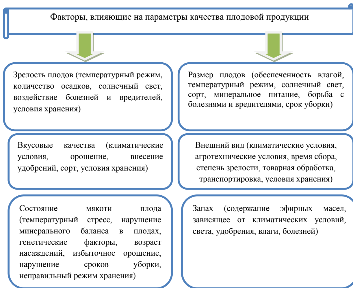
Рисунок 2 - Факторы, влияющие на показатели качества плодовой продукции.

Каждый параметр качества плодовой продукции находится под воздействием факторов, имеющих как комплексный характер воздействия, так и индивидуальный. Классифицируя факторы по укрупненным группам можно выделить природно-климатические условия, технологию производства, условия транспортировки, товарной обработки, хранения и реализации плодов. Каждая группа факторов оказывает непосредственное воздействие на параметры качества на соответствующей стадии их формирования [3].