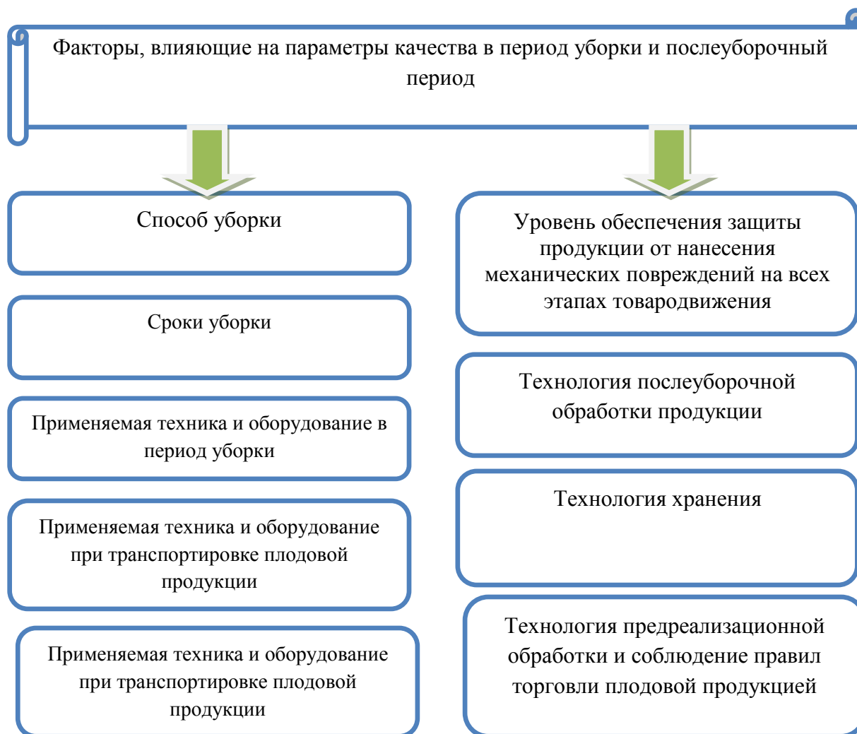
Рисунок 3 - Влияние факторов на качество плодов в период уборки и послеуборочный период.

Реализация наиболее качественной плодовой продукции сельскохозяйственными организациями Тамбовской области осуществляется по ценам на 25-30% выше, что способствует росту рентабельности сбыта продукции на 15-20 п.п. Несортовая плодовая продукция реализуется по ценам, не обеспечивающим рентабельное ведение отрасли.