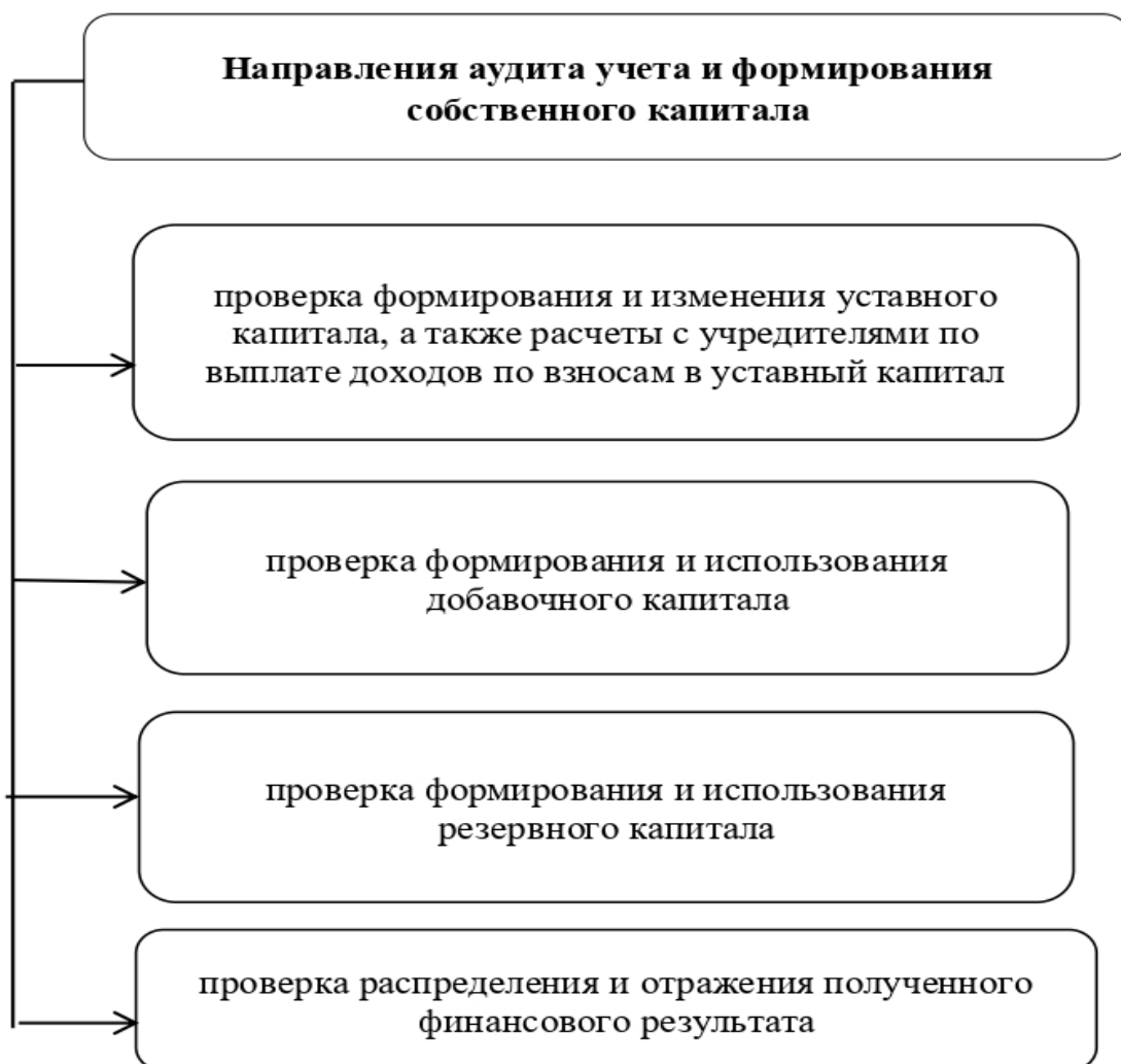
Рисунок 1 – Направления аудита учета и формирования собственного капитала в организациях АПК.

Аудит учета и формирования собственного капитала состоит из проверок по следующим направлениям (рисунок 1).