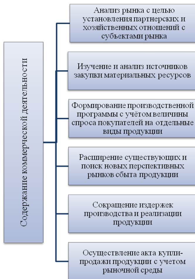
Рисунок 1 – Содержание коммерческой деятельности.

На рисунке 2 представлены этапы осуществления коммерческой деятельности.