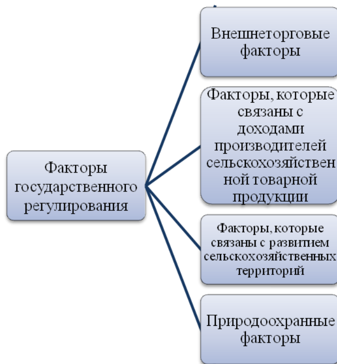
Рисунок 4 – Факторы, предопределяющие необходимость государственного регулирования сбытовой деятельности в АПК.

Стабильное развитие многоукладной экономики за счёт формирования рыночной среды, отвечающей современным социально-экономическим требованиям общества возможно исключительно при условии всестороннего государственного регулирования сбытовой деятельности предприятий АПК.