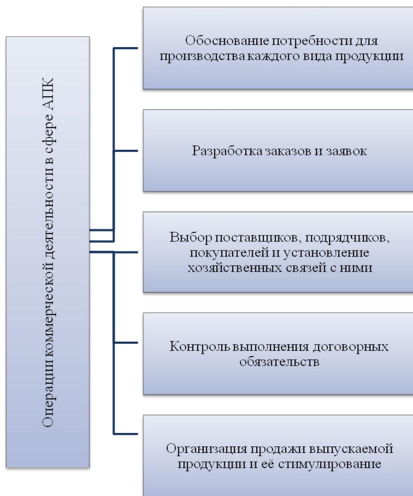
Рисунок 3 – Операции коммерческой деятельности в сфере АПК.

Развитие сбытовой деятельности всего АПК во многом предопределяют особенности главной отрасли – сельского хозяйства, осуществляющего производство сельскохозяйственной продукции. Данная отрасль имеет высокую значимость не только для обеспечения нации в достаточных объёмах высококачественной конкурентоспособной сельскохозяйственной продукцией собственного производства в условиях высокой значимости проблемы импортозамещения, а также практически все отрасли перерабатывающей промышленности сырьём для производства продукции переработки [2].