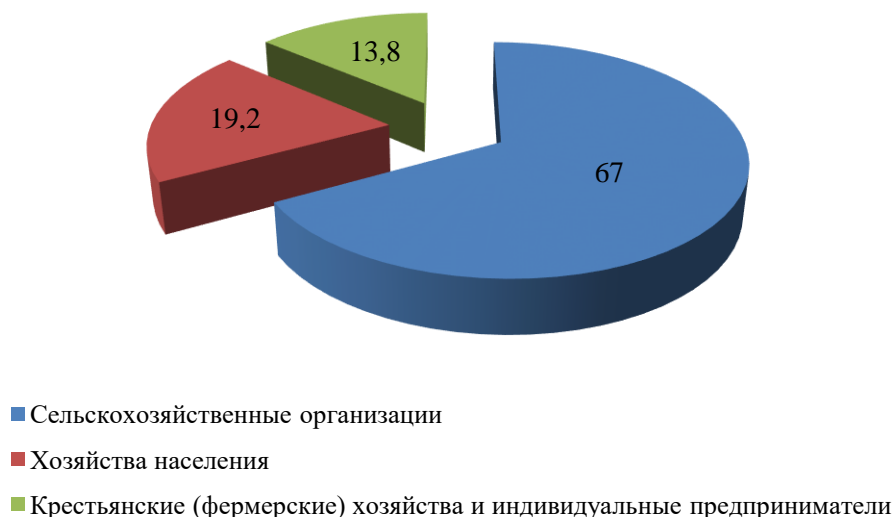
Рисунок 2 - Доля различных категорий хозяйств в объеме реализации молока, %.

Роль хозяйств населения в сбыте молочной продукции ниже по сравнению с производством, что объясняется невысокой товарностью деятельности данной категории хозяйств.