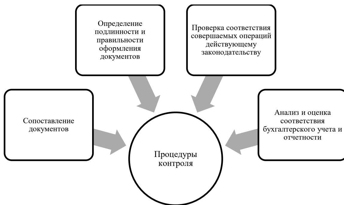
Рисунок 3 – Процедуры контроля.

Процедуры внутреннего контроля представляют собой действия, направленные на устранение рисков, влияющих на достижение целей организацией. Они выполняются самими работниками (самоконтроль); сотрудником, старшим по должности (взаимоконтроль), непосредственно после завершения операции; начальником структурного подразделения – при визировании всех документов, исходящих от подразделения (рисунок 3).