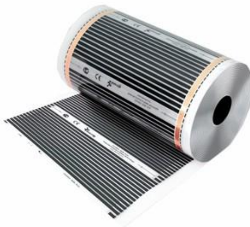
Рисунок 2 – Инфракрасный теплый пол.

Основным видом теплых полов пленочного вида является инфракрасный теплый пол (рисунок 2).