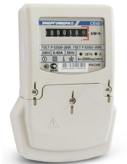
Рисунок 1 – Механический счетчик CE 101-S6.

Электросчетчик CE101-S6 предназначен для однофазного измерения активной энергии в двухпроводных цепях переменного тока. Устанавливается на щиток и использует шунт в качестве датчика тока, что обеспечивает его надежную работу.