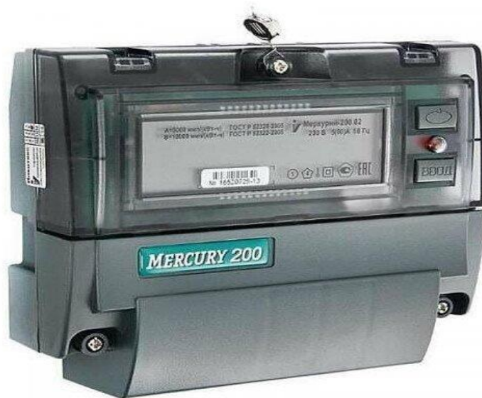
Рисунок 2 - Счетчик электроэнергии Меркурий 200.

Примером электронного счетчика может служить «Меркурий 200» (рисунок 2) [3].