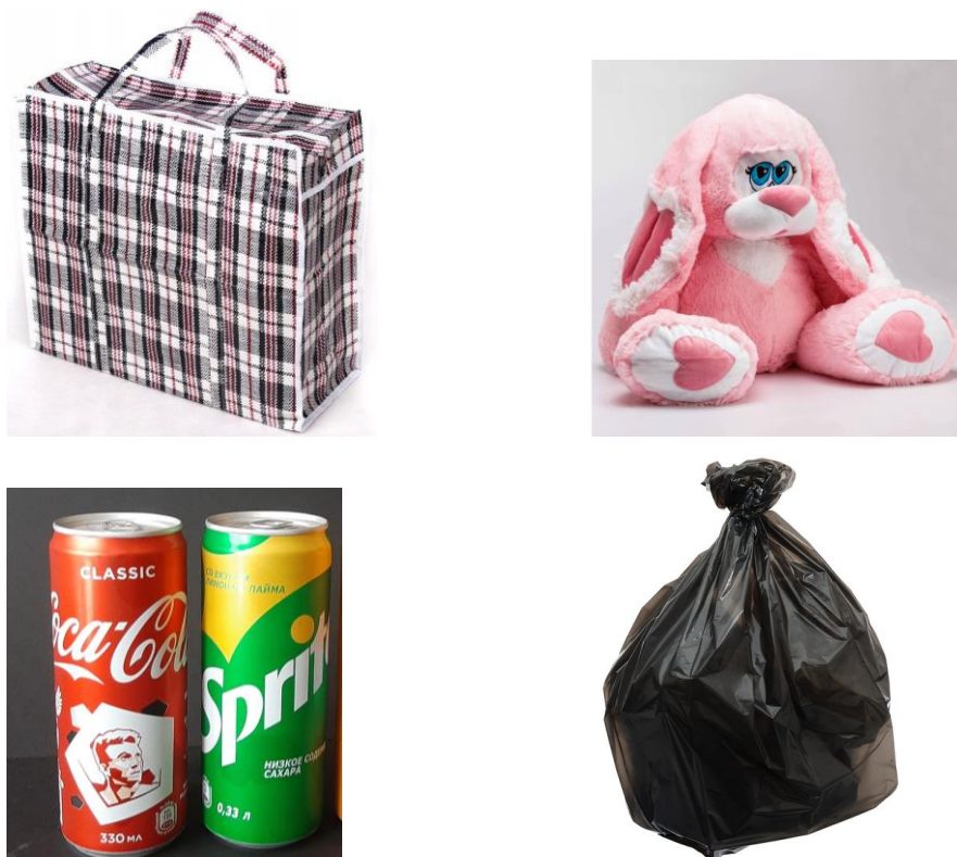
Рисунок 3 – Пример предметов для 4 этапа квеста.

5 этап. Перед кабинетом стоит модератор и вручает задание команде. Этот кабинет и все его содержимое относится к определенному предмету, но также в нем находятся «лишние» вещи. Ваша задача определить их и принести мне. На выполнение задания отводится 5 минут. Сложность задания состоит в том, что кабинет «заминирован» и если раздастся звук колокольчика, то игрок – выбывает. И выполнять задание нужно в полной тишине, т.к. вас могут услышать «захватчики».