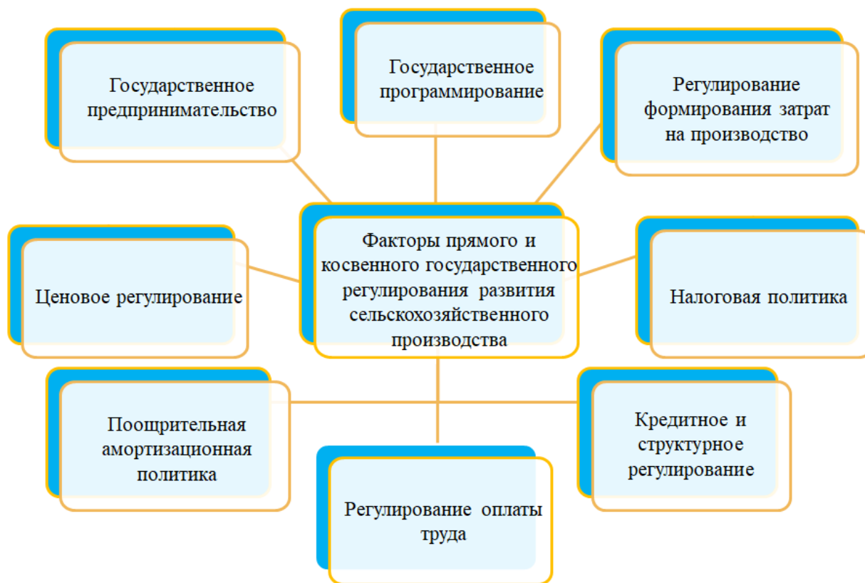
Рисунок 4 – Факторы прямого и косвенного государственного регулирования развития сельскохозяйственного производства.

Для обеспечения эффективного функционирования сельскохозяйственных организаций, государство по мере необходимости и с учётом экономической ситуации, должно комплексно использовать факторы регулирования развития сельскохозяйственного производства, и, самое главное на наш взгляд осуществление регулирования формирования затрат на производство.