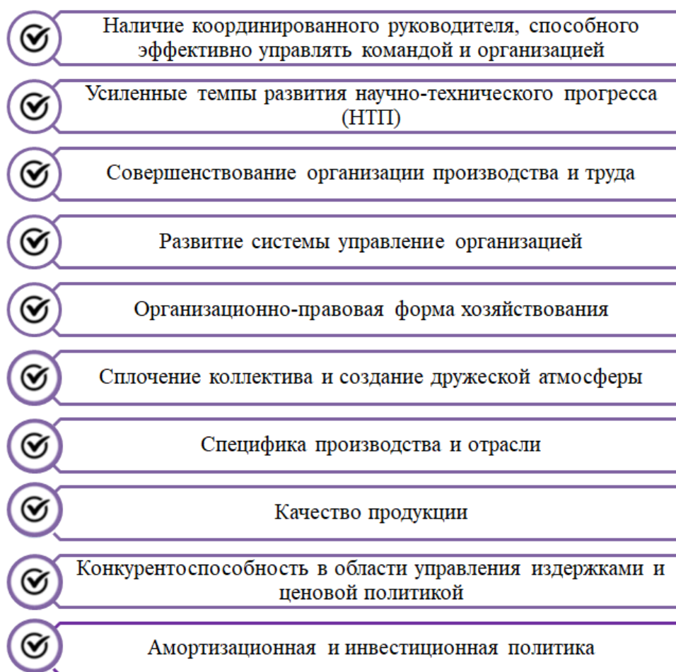
Рисунок 2 – Внутренние факторы, влияющие на эффективность деятельности организаций.

Таким образом, можно провести прямую зависимость государства в сфере рыночных отношений. Именно от государственного регулирования во многом зависит эффективная деятельность организаций.