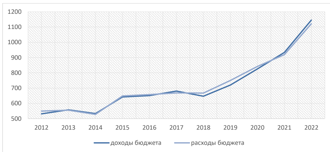
Рисунок 3 – Динамика доходов и расходов Мичуринского муниципального округа за период с 2012 по 2022 год.

Проводимая комплексная работа по созданию комфортной бизнес среды позволяет сохранять стабильность на рынке труда, а также создавать новые рабочие места. Уровень официально регистрируемой безработицы второй год сохраняется на уровне 0,6% против 0,8% в целом по стране.