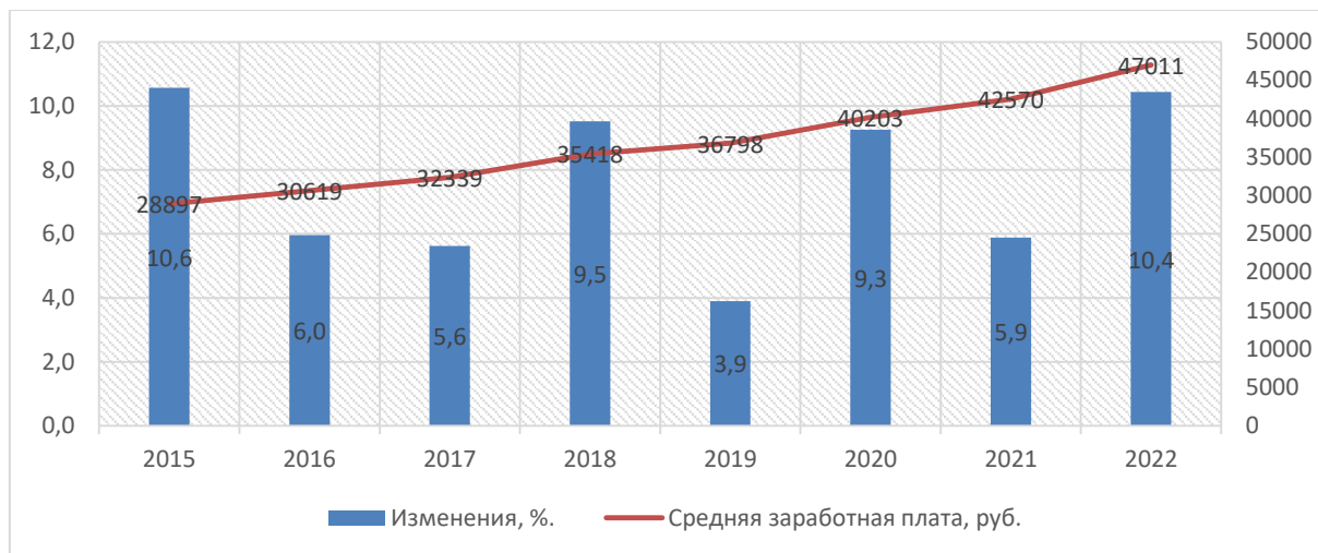
Рисунок 1 – Рост размеров средней заработной платы в Мичуринском муниципальном округе за период с 2015 по 2022 год.

средний размер заработной платы Мичуринского Муниципального округа увеличен на 9-12% по сравнению со средним размером оплаты труда [6].