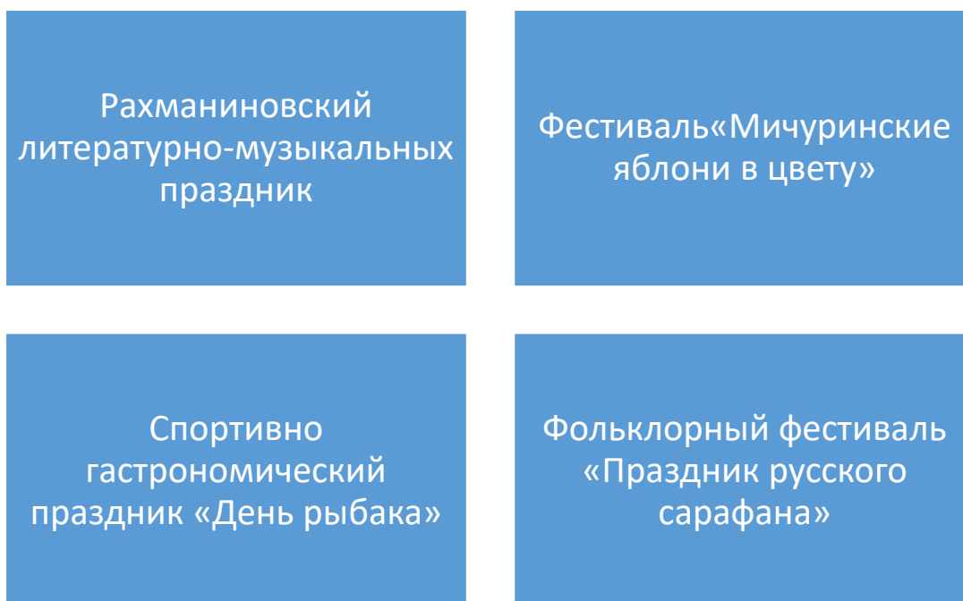
Рисунок 3 – Мероприятия событийного туризма в Мичуринском муниципальном округе

В рамках развития агротуризма в Мичуринском МО в конкурсе на получение гранта «Агротуризма» приняла участие семья с проектом «Татьянина усадьба». На развитие проекта было выделено 10 млн руб. Грант был направлен на строительство в центре яблоневого сада комплекса для приёма туристов и на организацию интересных туристических программ с технологическими мастер-классами.