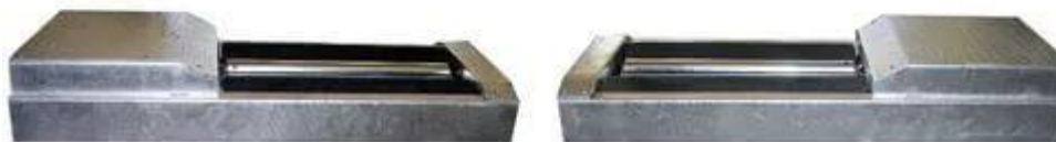
Рисунок 4 - Силовой роликовый стенд Safelane Truck N SC 15T фирмы «Hoffmann».

Особенностью данного стенда является включение барабанов при возникновении давления на барабанный блок, что облегчает работу оператора, при этом пробуксовка колеса вызывает выключение вращения барабанов, для облегчения съезда транспортного средства упорный барабан установлен выше приводного [10].