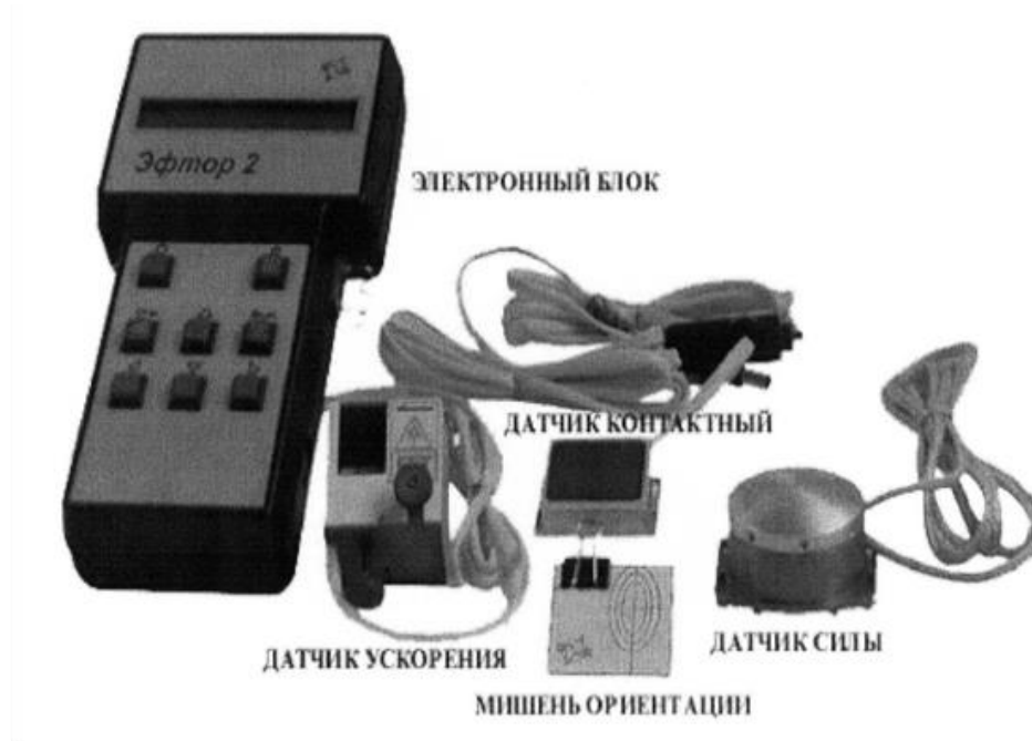
Рисунок 1 - Общий вид прибора для проверки эффективности рабочих тормозных систем транспортных средств типа ЭФТОР 2.

Операторы на станциях технического осмотра для оценки работы тормозов в различных условиях дорожным методом используют прибор типа «ЭФТОР 2» (рисунок 1).