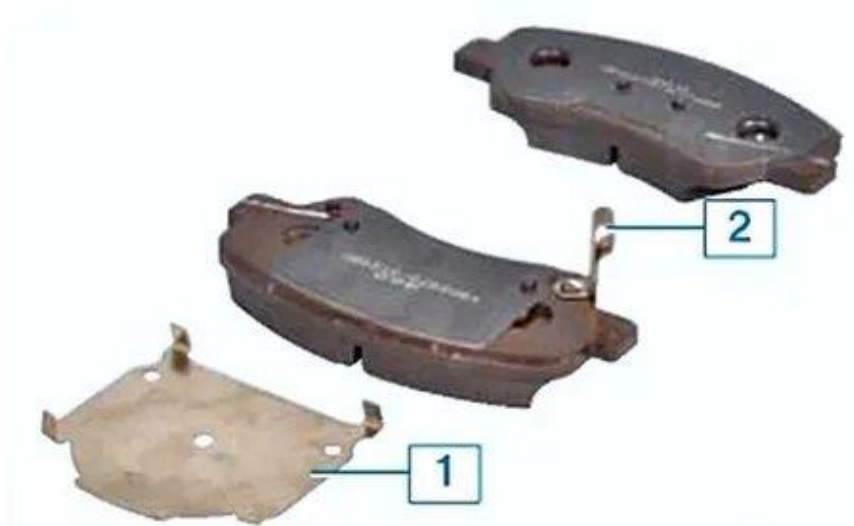
Колодки переднего тормозного механизма: 1 - противовибрационная пластина; 2 - акустический индикатор износа

Самым простым средством определения степени истирания тормозной колодки является металлическая полоска, которая начинает издавать звуки при критическом износе (рисунок 5).