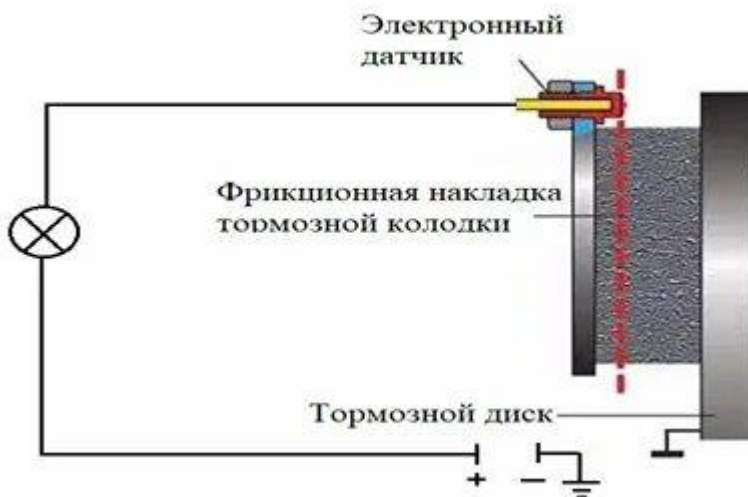
Рисунок 6 – Электронный датчик степени изменения толщины фрикционной накладки.

Электронным элементом является датчик (рисунок 6) в виде корпуса из диэлектрического материала, внутри которого располагается металлическая сердцевина.