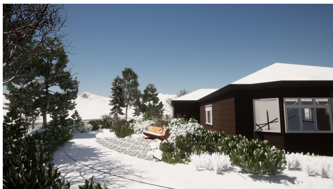
Рисунок 4– Визуализация проекта – зимний период.