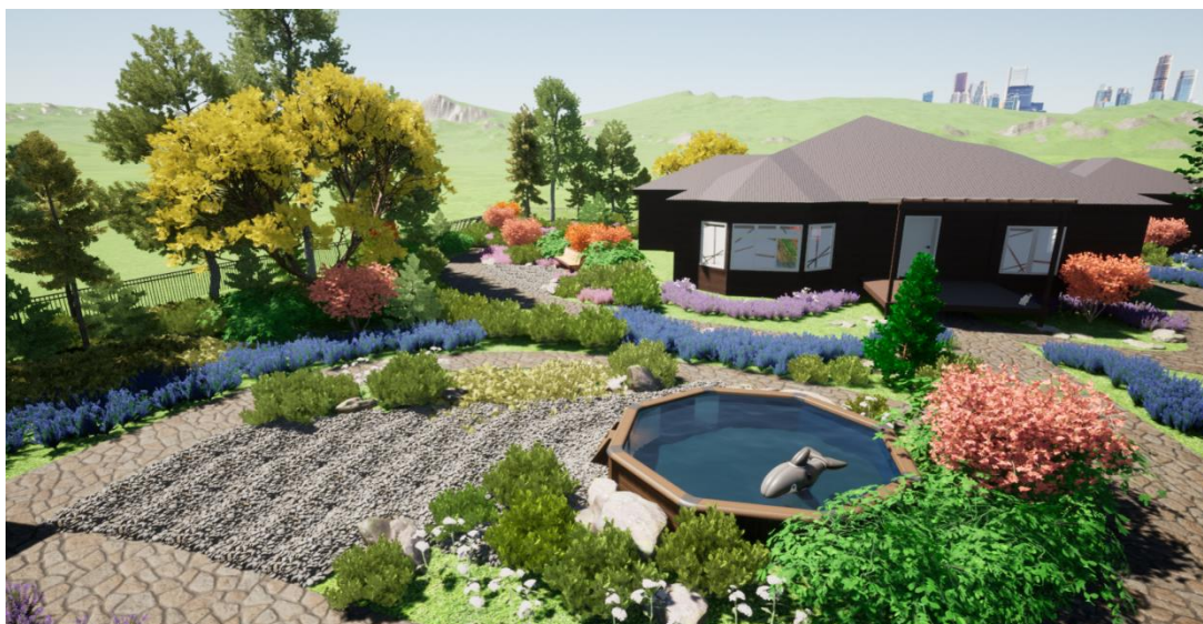
Рисунок 3– Визуализация проекта – осенний период.