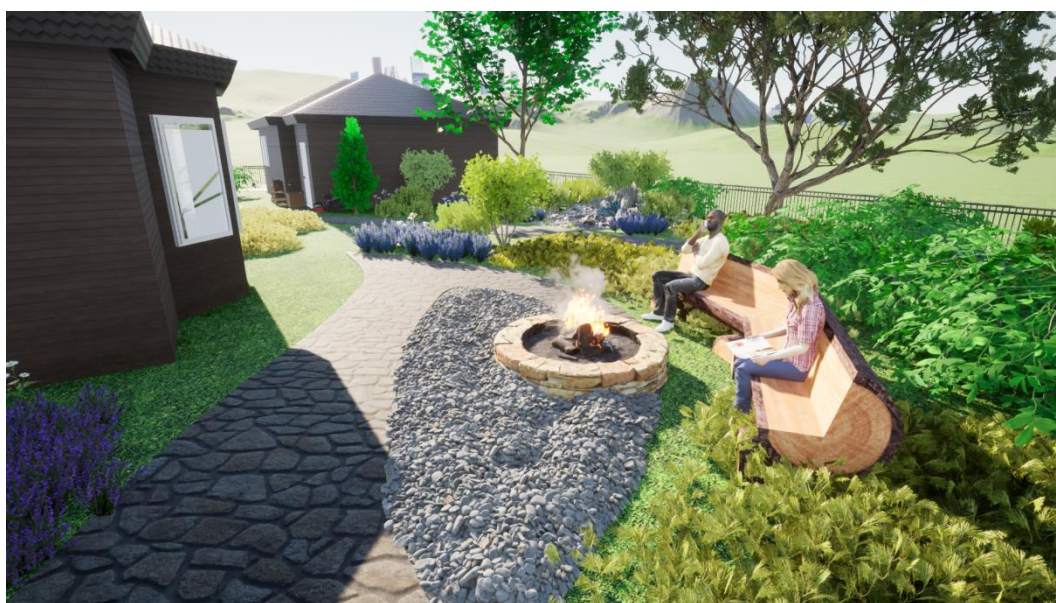
Рисунок 2– Визуализация проекта – летний период.