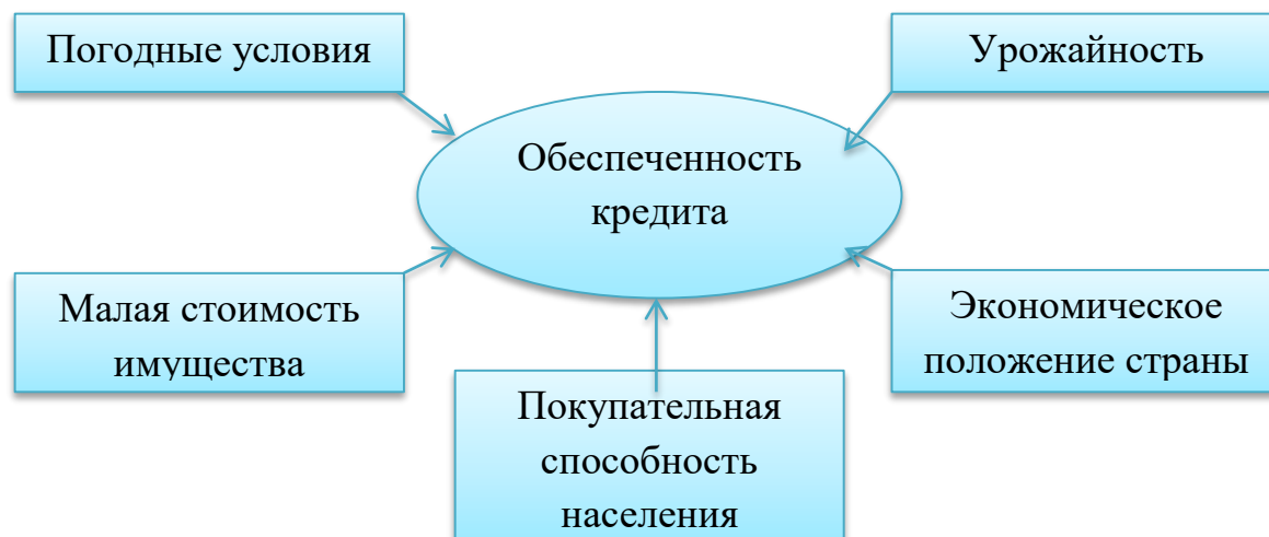
Рисунок 3. Факторы, влияющие на обеспеченность кредита

Еще одной проблемой на пути кредитования является необеспеченность кредита. На рисунке 3 отражены факторы, влияющие на обеспеченность кредита.