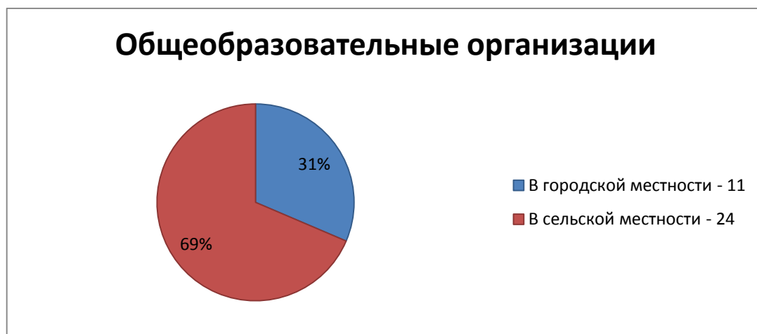
Рисунок 1 - Количество общеобразовательных организаций в г. Мичуринск и Мичуринском муниципальном округе

В городе Мичуринск и Мичуринском муниципальном округе всего насчитывается около 35 образовательных организаций, реализующих программы общего образования, из них 11 в городской местности, 24 - в сельской (рис.1).