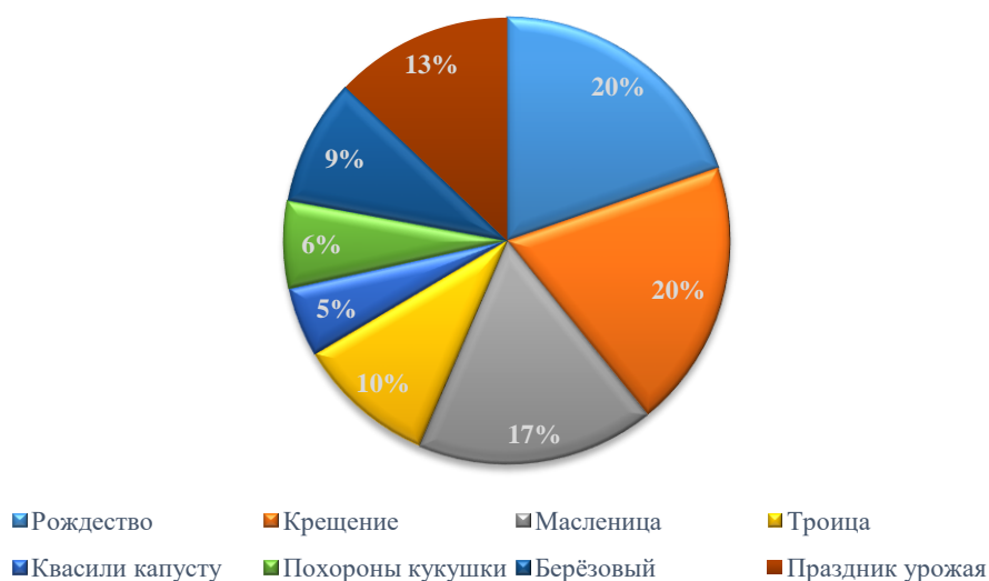
Рисунок 1 – Русские традиции и праздники, %

2. Ответы респондентов, демонстрирующие ими знание современных российских праздников.