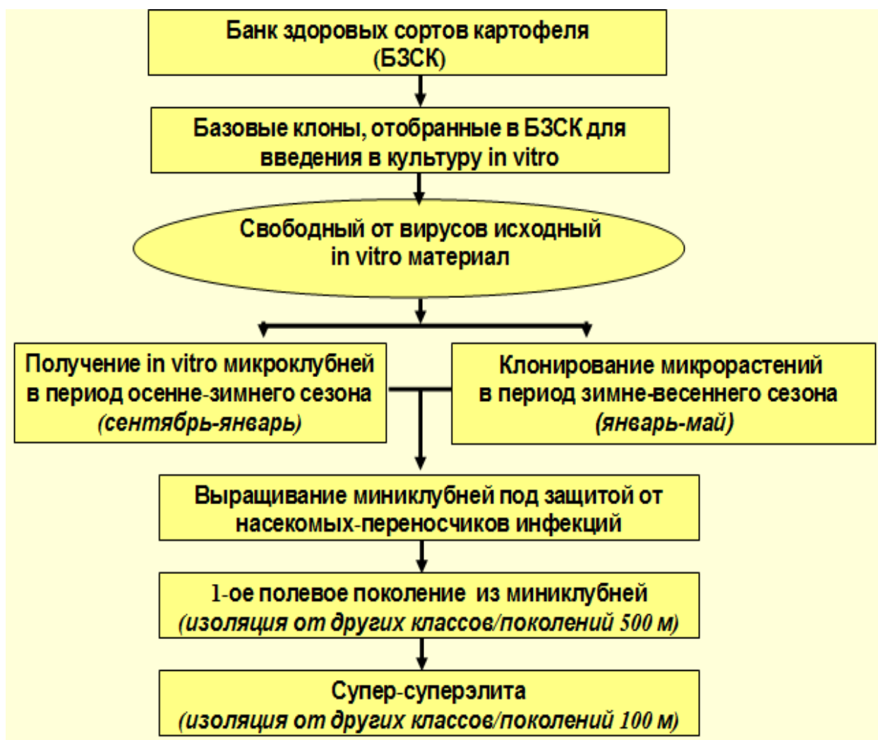
Рисунок 1 - Инновационная схема получения оригинального семенного картофеля

сами микрорастения выращенные в культуре in vitro , использование одного из описанных выше вариантов в качестве исходного материала на выходе при соблюдении всех технологических процессов и приемов позволяет получить оригинальный семенной материал так называемые миниклубни [3].