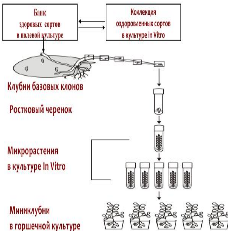
Рисунок 2 - Схема получения миниклубней на основе базовых клонов из БЗСК

необходимые процессы роста и тиражирования материала для увеличения объема производства, микрорастения подготавливаются для дальнейшего использования в семенном процессе в условиях защищенного грунта, или к примеру аэропонных установках [2].