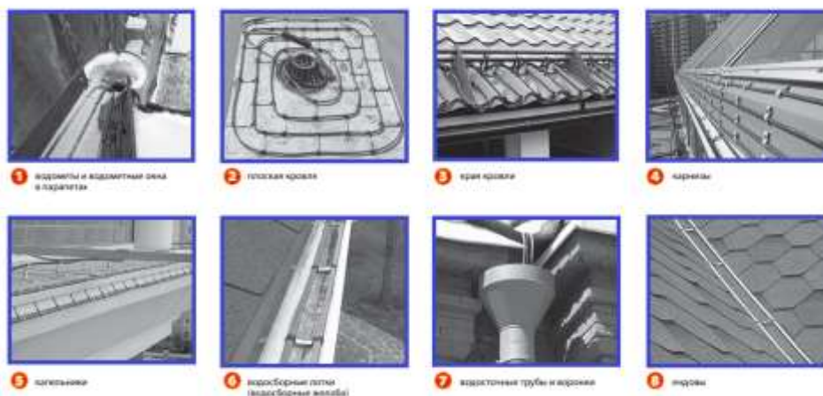
Рисунок 1 - Типовые зоны обогрева кровли