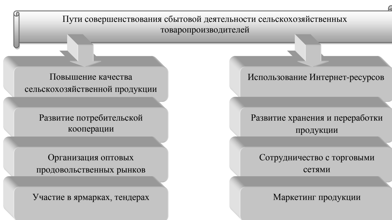
Рисунок 3 - Пути совершенствования сбытовой деятельности сельскохозяйственных товаропроизводителей

Основными проблемами, которые были выявлены в результате проведенного исследования, являются нестабильный уровень рентабельности продаж сельскохозяйственной продукции и недостаточная величина данного показателя. На рисунке 3 представлены пути совершенствования сбытовой деятельности сельскохозяйственных товаропроизводителей, которые будут способствовать устранению ряда недостатков, связанных с реализацией сельскохозяйственной продукции. [1,3,4]