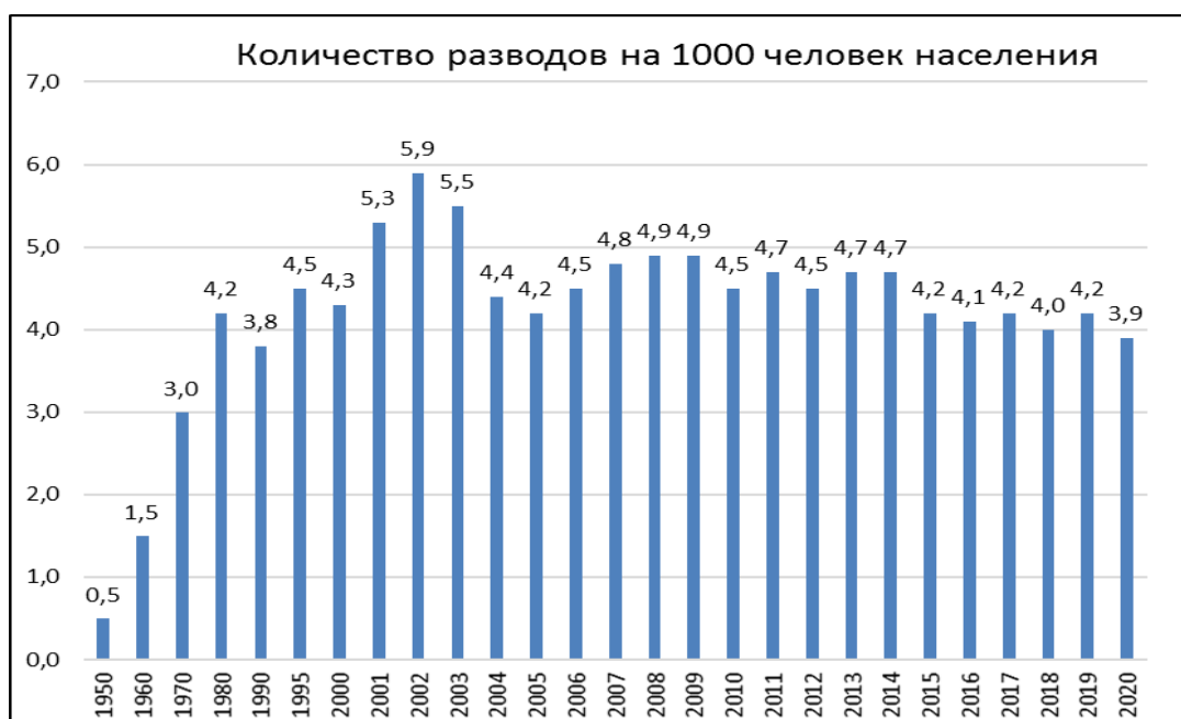
Рисунок 4 – Динамика разводов (на 1000 человек населения)

Мы считаем, что поиск пути преодоления демографического кризиса не должен сводиться только к внедрению практик развитых стран, к популяризации семейных ценностей и материальному стимулированию рождаемости. Для решения данной проблемы необходим комплексный подход, иначе результаты если и будут, то краткосрочные [5].