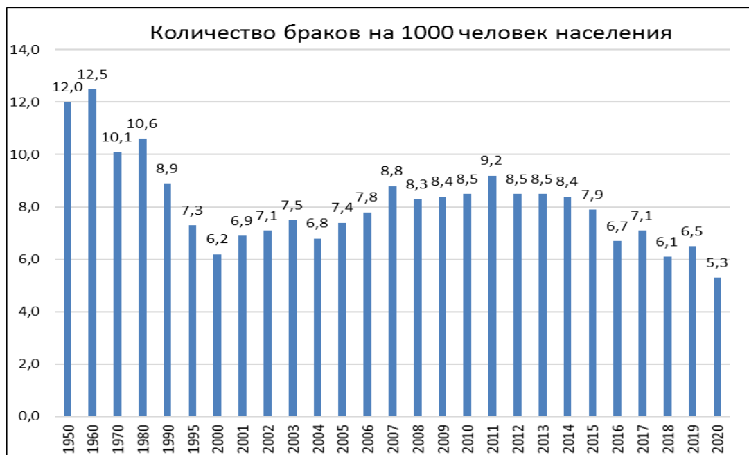
Рисунок 3 – Динамика заключения браков (на 1000 человек населения)