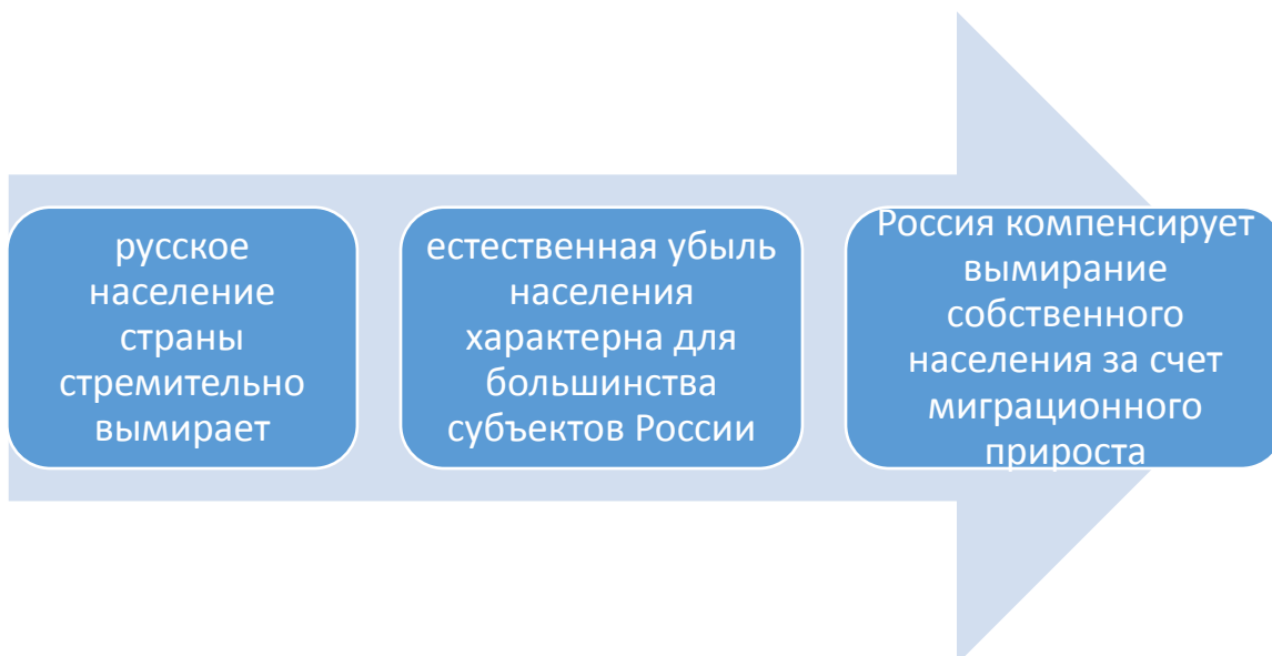
Рисунок 2 - Характерные черты демографической ситуации в РФ

Последние годы характеризуются миграционным приростом (на 230–300 тысяч человек ежегодно), 96% из общего потока – это выходцы из стран постсоветского пространства. Если в предыдущие годы мигранты прибывали к нам в основном из республик Средней Азии, то в настоящее время, в связи с ужесточением законодательства и обесцениванием рубля, а также с началом конфликта на Украине, растет число граждан Украины, которые приезжают в Россию, как с целью заработка, так и в надежде найти убежище.