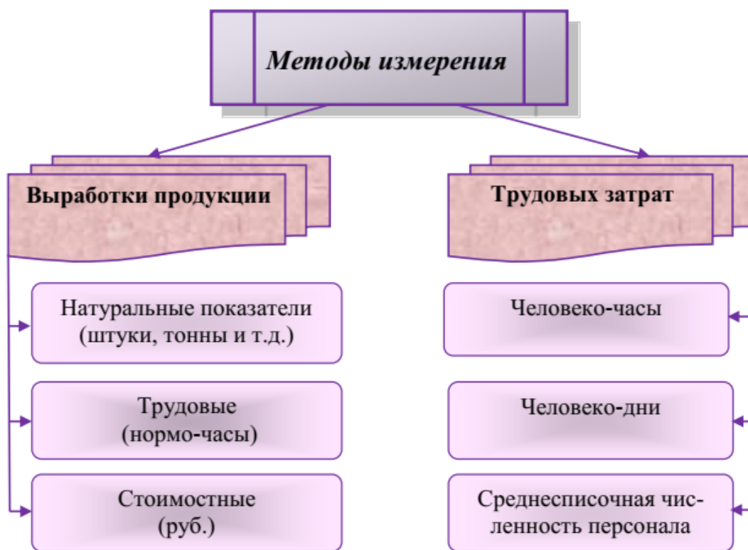
Рисунок 3 – Разновидности показателей выработки и трудовых затрат

Основными, экономическими критериями эффективности использования кадров в сельскохозяйственной организации являются выработка продукции и затраты труда, которые могут определяться по-разному (рисунок 3).