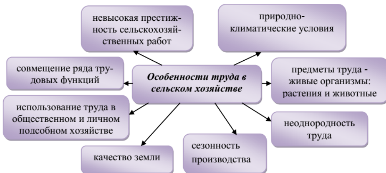
Рисунок 1 – Особенности труда в сельском хозяйстве

Процесс формирования рабочей силы в сельском хозяйстве определяется спецификой самой отрасли и имеет свои особенности (рисунок 1).