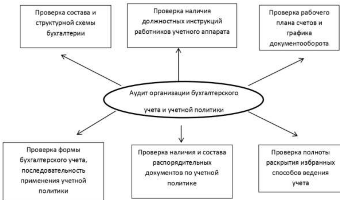
Рисунок 2 - Направления аудита организации бухгалтерского учета и учетной политики в организациях АПК

Планирование аудита системы бухгалтерского учета и учетной политики в организациях АПК осуществляется с целью: