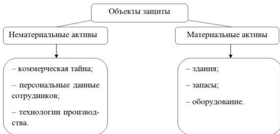
Рисунок 2 – Объекты защиты внутренней экономики предприятия.

Следует отметить, что сущность термина «экономическая безопасность» применяют только к защите нематериальных и материальных активов. На наш взгляд, данное соотнесение неверное, так как приоритетной сферой защиты экономической безопасности заключается в его устойчивости при наличии как внешних, так и внутренних угроз. Поэтому важными объектами защиты должно стать обеспечение: