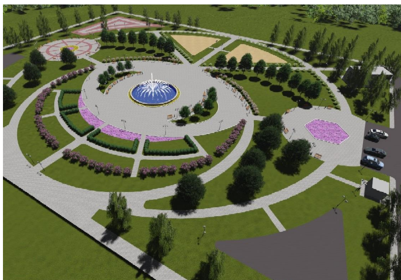
Рисунок 2.3D – визуализация территории многофункционального парка в мкр.

В центральной части парка будет располагаться фонтан, возле которого размещены парковые диваны, кованые урны и садовые фонари. В жаркое время эта зона будет притеняться за счет рядовых насаждений каштана конского. Это позволит сделать отдых посетителей более комфортным.