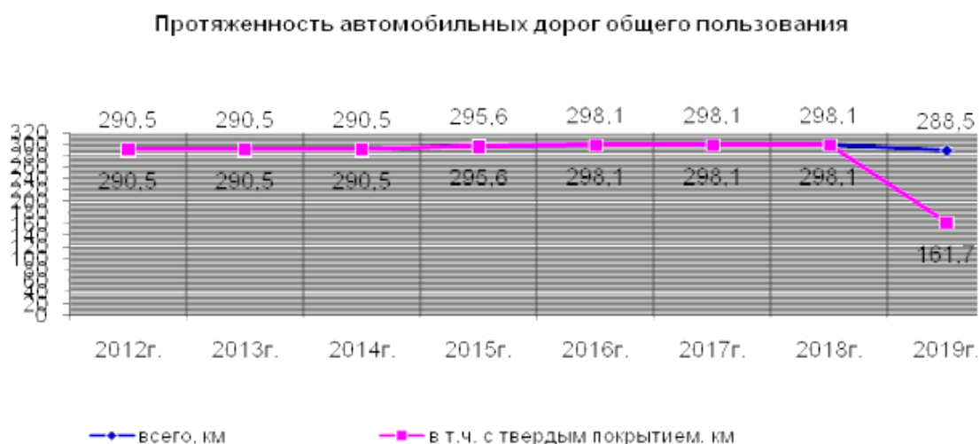
Рисунок 3 - Автомобильные дороги Кораблинского района Рязанской области, км.

Важно для развития территории муниципалитета сеть автомобильных дорог. По территории района проходит Московско-Рязанская железная дорога. Расстояние от г. Кораблино до г. Рязани по железной дороге составляет 85 км. Автобусные пассажирские перевозки в районе производятся ОАО «Кораблинское автотранспортное предприятие». По городу - по 1 маршруту, внутрирайонные - по 8 маршрутам и межрайонные – 3 маршрута,