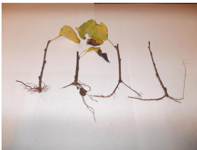
Рисунок. 1. Подвой груши ОНФ 333 обработанный стимулятором роста Янтарной кислотой

Хорошей степенью укоренения (от 50,0 до 55,0%) было отмечено у сортов груши Ника, Яковлевская.