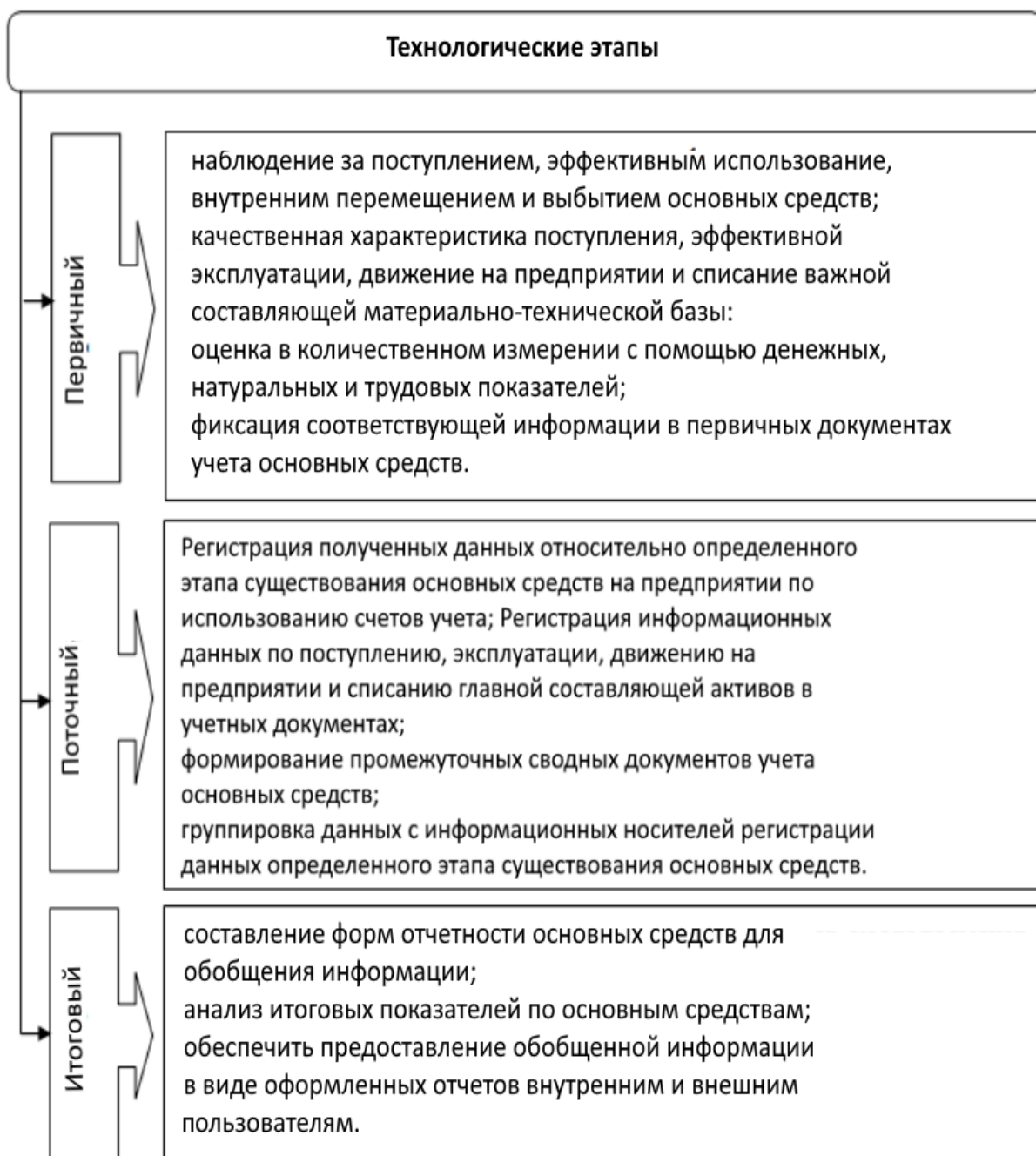
Рисунок 1 - Группировка учетных операций основных средств в соответствии с технологическими этапами учета

Совершенствование учета группы основных средств «Машины и оборудование» будет способствовать положительному влиянию на существующую на предприятии систему бухгалтерского учета и внутрихозяйственного контроля, на эффективность использования всей совокупности средств производства сельскохозяйственного предприятия.