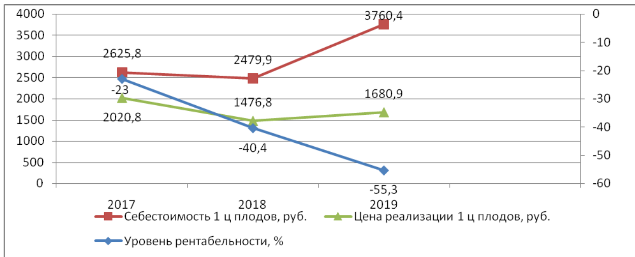
Рисунок 3 - Динамика уровня убыточности, себестоимости и цены реализации 1 ц плодов

На рисунке 3 представлена динамика уровня убыточности, себестоимости и цены реализации 1 ц плодов.