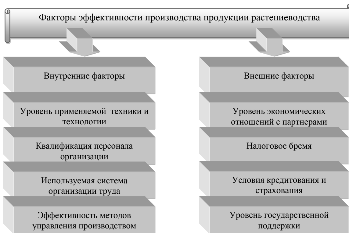
Рисунок 1 - Факторы эффективности производства продукции растениеводства

Рассмотрим эффективность производства зерна в АО учхоз-племзавод «Комсомолец».