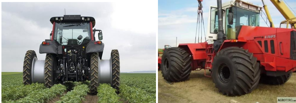
Рисунок 1 - Тракторы с разной колеей колес

Для определения уплотнения почвы под действием вертикальной силы (масса на колесе) создаваемой двигателем энергонасыщенного трактора возьмем объем почвы по центру следа колеса и разобьем его на бесконечно малые слои толщиной dU . Примем, что расположение частиц почвы бессистемно, это будет характеризовать почву как анизотропную систему. Силу, действующую на выделенный объем почвы под единичным двигателем трактора, представим в виде сосредоточенной силы P . В качестве основных переменных выберем плотность почвы \gamma и смещение точек U вдоль вертикальной оси. Тогда энергия деформации почвы будет зависеть от изменения плотности \gamma - \gamma_0 ( \gamma_0 - плотность недеформируемой почвы) и от производных смещений U по координате z . Тогда формула для свободной энергии деформации примет вид: