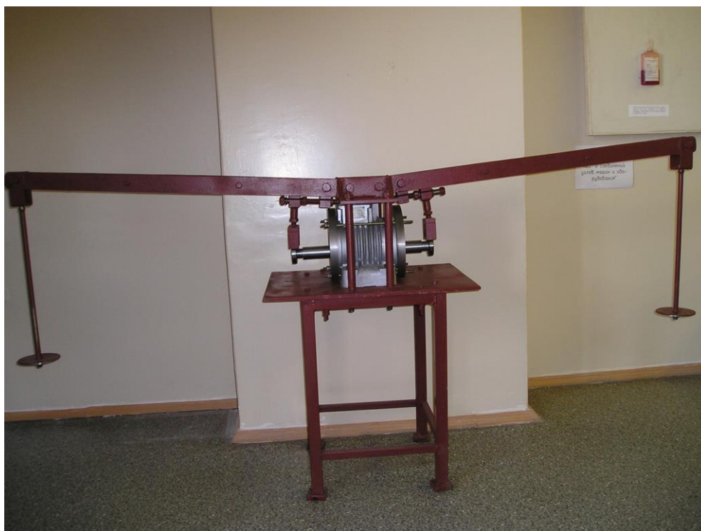
Рисунок 1 – Стенд для испытания подшипников при статическом нагружении

Конструкция стенда состоит из опорной рамы с установленным на ней корпусом электромеханического вибратора марки ИВ-107А с щитами для испытываемых подшипников. В корпусе установлен специальный вал. На валу смонтированы два испытываемых, опорных подшипника и два вспомогательных подшипника. Также на вал напрессован якорь. Корпус имеет обмотку статора. Рычаг создает нагрузку. Для регулировки используют винтовой регулировочный механизм, который обеспечивает регулировку телескопической стойки и нагрузочной вилки, в осевом направлении.