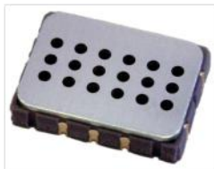
а) внешний вид сенсора, размеры 7×5×1,5 мм

Содержание CO, NO, NH 3 , как содержание любых вредных веществ в воздухе рабочей зоны, не должно превышать предельно допустимых концентраций - ПДК.