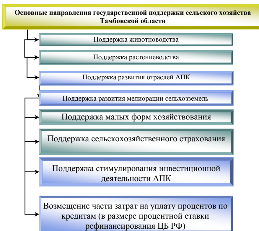
Рисунок 1 – Основные направления Государственной программы развития сельского хозяйства и регулирования рынков сельскохозяйственной продукции, сырья и продовольствия Тамбовской области на 2013 – 2020 годы

В Государственной программе развития сельского хозяйства и регулирования рынков сельскохозяйственной продукции, сырья и продовольствия Тамбовской области на 2013 – 2020 годы предусмотрены основные направления государственной поддержки – рисунок 1, а размеры ставок согласно данной программе представлены в таблице 1.